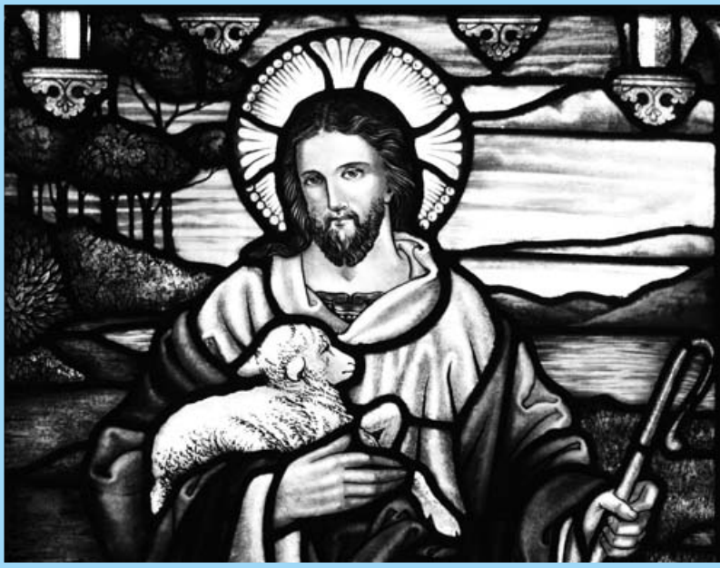
此“耶穌是好牧人”鑲嵌玻璃窗，是置放在澳大利亞 Ashfield，建於 1840 年的 St. John the Baptist Anglican Church。