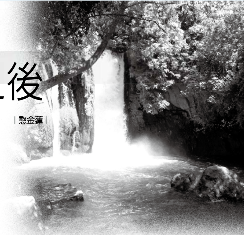
離加利利湖北方25英里，黑門山山腳的瀑布 The Banias Waterfall。

到了教會，我才發現，雖然信的都是上帝，但我信得不明白。我不明白上帝的旨意，也沒有人告訴過我啥是對的、啥是錯的，何謂罪，犯罪有何危害……我由此認識到，我雖然信耶穌，但還是活在罪中。也正是我的罪，給我帶來了疾病、患難。