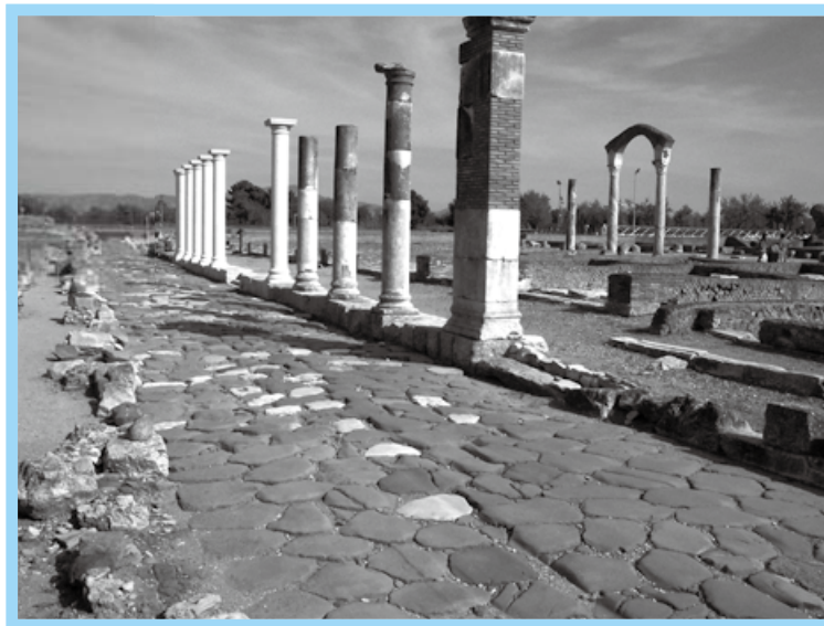
通往羅馬的 Appian way

羅馬帝國又是另外一種情況。爲了軍事的需要，羅馬人到處建造公路（至今常用的西方諺語“條條道路通羅馬”，就是其最好寫照）。羅馬人造的最早的一條公路，叫做 Appian Way，從羅馬通向義大利南方。從附圖