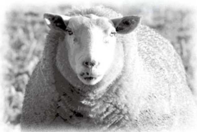
你是哪一種羊？