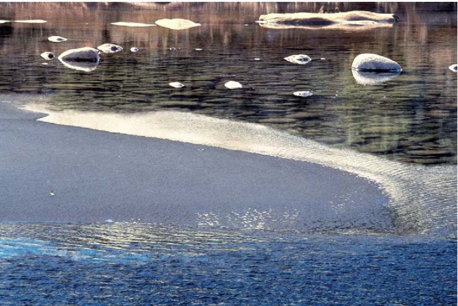
溪邊——1999年攝於美國亞利桑那州 | 鍾榮光

無盡重複輪換的意念與活動， 無盡的發明，無盡的實驗 帶出動的知識，而不是靜的； 講述的知識，而不是沉默的； 文字（words）的知識，卻漠失了“道”（the Word）。