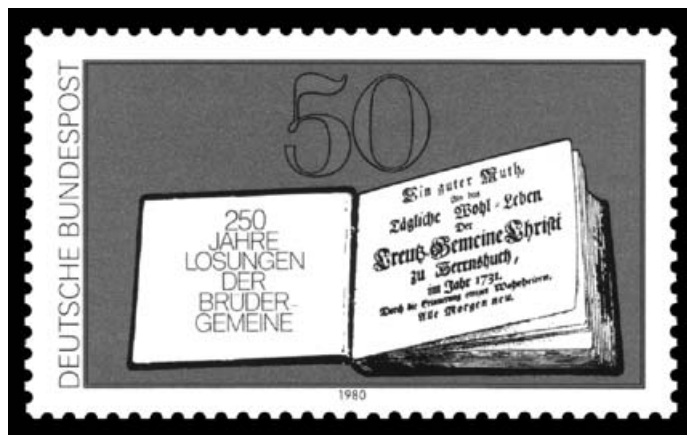
1980年出版的郵票上，印著有250年之《每日靈糧》的第一份出品。設計者為Peter Steiner。

1722年，他在這片土地上接待、安置了從摩拉維亞來此避難的摩拉維亞弟兄會信徒300多人，並且為這片土地取了一個光輝的名字：Herrnhut——主護村，意為“這座城不僅是在主耶穌的守護之下，城中的每位居民也將成為上帝國度的守護者。”