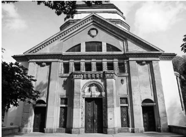
在格爾利茨（Görlitz）的猶太會堂（Synagoge）。建於 1909-1911 年。在經過 1938 年 11 月 9 日的屠殺之後，這座建築竟然只受了輕微的損害。

滿大街找吃的，哪怕是餅乾、糕點之類的都行，但是所有的商店都關上了大門。這是普天共慶的時刻，沒有人還在做生意。也許火車站裡還有商店開門？趕去一看，也讓我失望。