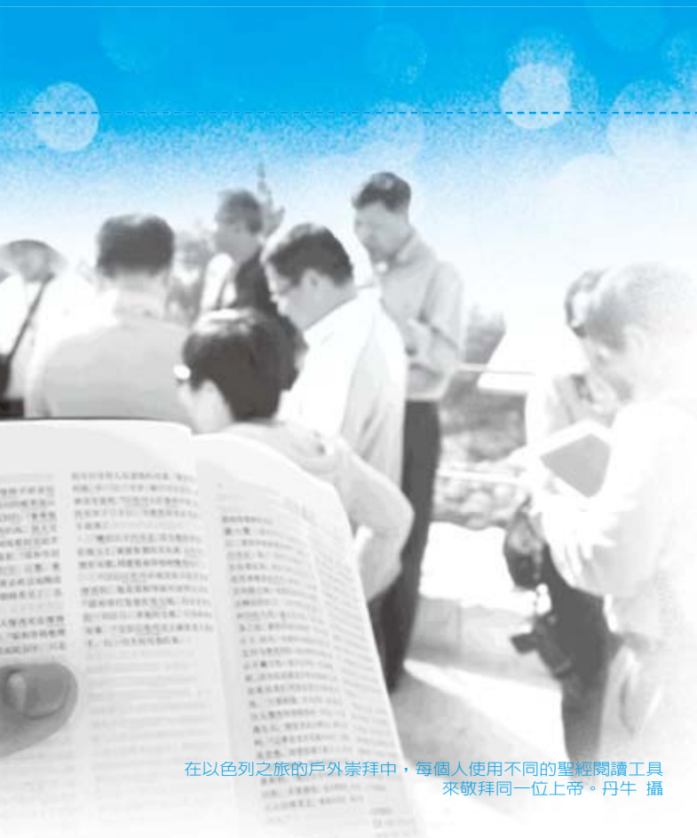
在以色列之旅的戶外崇拜中，每個人使用不同的聖經閱讀工具來敬拜同一位上帝。