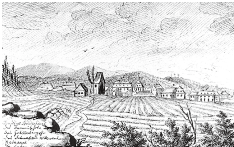
1765 年的主護村 —— 德國研究員與檔案專家 Günter Rapp (1933–1990) 的作品。現存於德國 Dresden 的圖像圖書館 (picture library) the Deutsche Fotothek。

我們將這次行程的住宿，定在格爾利茨 (Görlitz)。這是一座歐洲文化名城，不僅美麗，也離主護村不遠。