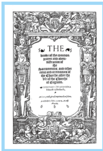
出版於 1549 年的 Book of Common Prayer

她的洞見擴展了我的肢體敬拜，不再只是想對主表達順服時，才跪拜或俯伏，而是在心裡煩躁或