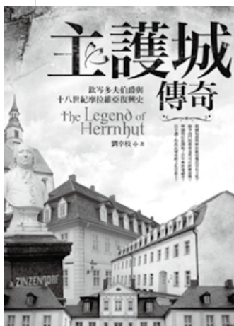
《主護城傳奇》一書封面

裡訂到每年度的 Losungen（有人譯為《每日靈糧》）。德國基督教會還有一年一度的 Losung，比如今年的 Losung 是：至於我，“我親近上帝是與我有益”（《詩》73：28）。