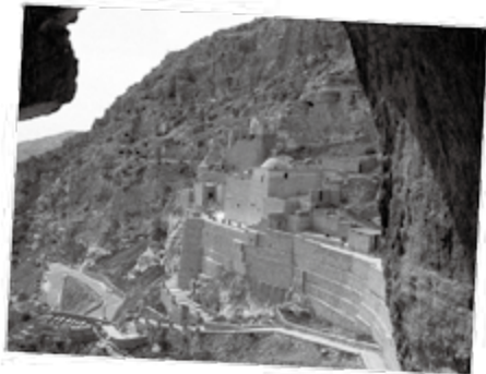
伊勒歌斯城山边的修道院