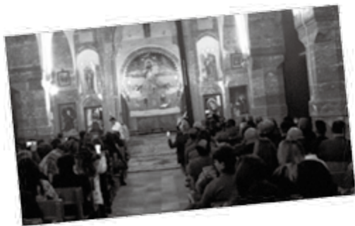
伊勒歌斯城的亚述教会庆祝2016年的复活节