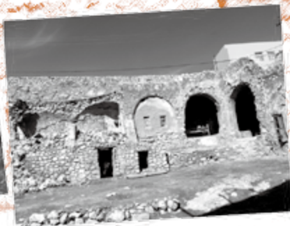
旧犹太人会堂遗址