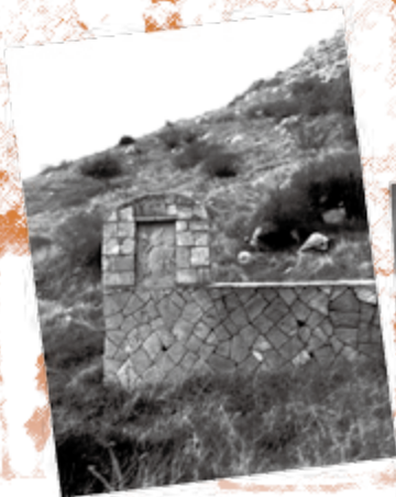
墙上雕着耶稣背十字架的故事