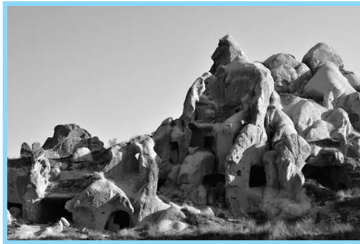
岩窟教堂，位於土耳其加帕多家（Cappadocia）中部的葛萊美（Göreme National Park）。公元一世紀，不少的基督徒在受迫害時逃到這裡來躲藏。是他們在岩窟中挖掘教堂、修道院，直到了奧圖曼土耳其時代。

瀆神的行爲，譬如：不正當的性行爲、偷竊、拜偶像、巫術、搶劫、作假見證、假冒爲善、欺騙、詐騙、傲慢、怨恨、頑固、貪婪、說下流話、嫉妒、無恥、自大、狂妄等。