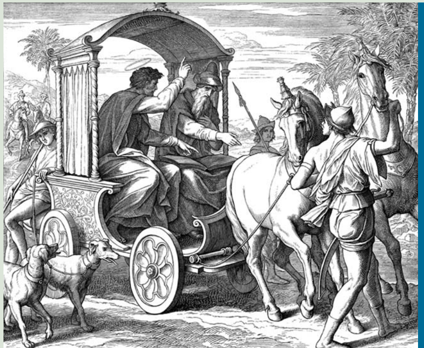
德國畫家 Julius Schnorr von Carolsfeld (1794-1872) 的作品。