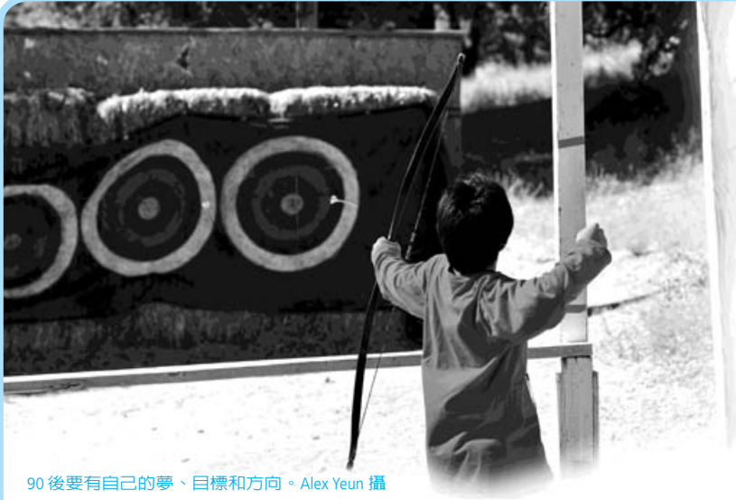
90 後要有自己的夢、目標和方向。

這樣的理念其實未必正確。90 後是可以託付的，端看我們能否將他們的創意，轉化成動力？（From “youthful idea” to “useful idea”）給年輕人有夢可想，去查驗在他們身上神的計劃與旨意為何。