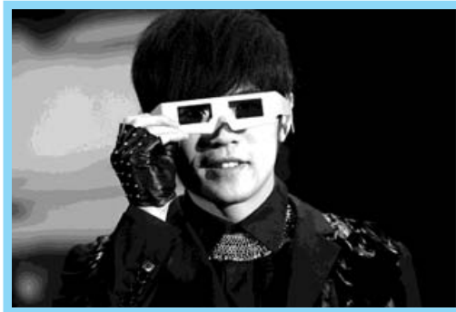
周杰倫代表新一代的視野。