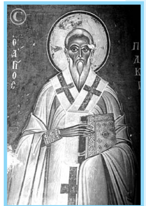
坡旅甲的壁畫。10 世紀初由聖盧卡斯（Osios Loukas or Hosios Loukas）所建立的東正教（又稱希臘正教）修道院（和教堂），為當今世界最重要的拜占庭藝術與建築。

在坡旅甲殉道前不久，他曾到羅馬，在街上碰到異端首領馬吉安（Marcion），坡旅甲沒有理睬他。馬吉安趨前來問：“你認識我嗎？”坡旅甲冷靜地