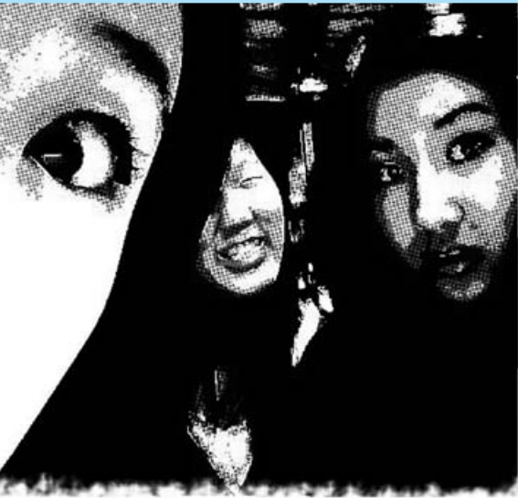
Celina Tu 攝 FromWeb