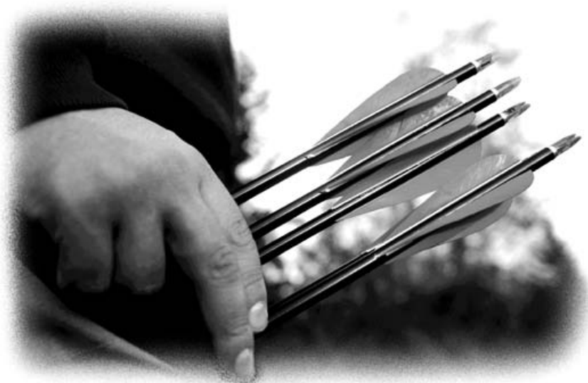
少年時所生的兒女好像勇士手中的箭。（《詩》127：4）

“誰”來教，將會決定我們所選取的材料。我們會容許孩子去閱讀達爾文的《小獵犬號航海記》，或是《物種起源》嗎？我