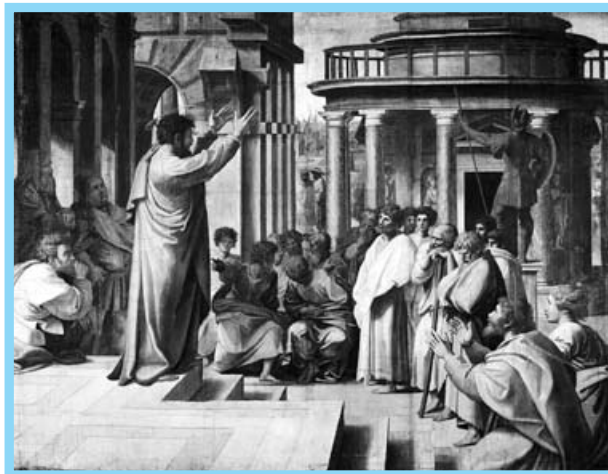
義大利畫家和建築師拉斐爾 (Raffaello Sanzio da Urbino, 1483–1520) 於 1515 年的畫作《使徒保羅在亞略巴古向雅典人傳講與辯論》。

“改革宗護教學”，則包括范泰爾 (Cornelius Van Til) 啓示性的“預設論護教學” (Presuppositionalism)、Gordon Clark 的公理式“預設論護教學”，以及普蘭丁格 (Alvin Plantinga) 認識論的“改革宗護教學”。近年來，這幾類護教方式相當流行，所以我們會在下文稍作介紹。