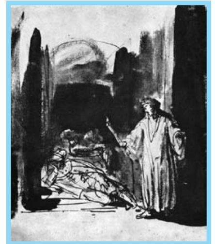
夜間的撒母耳和以利（Samuel Eli in the night），為荷蘭畫家林布蘭（Rembrandt Harmenszoon van Rijn，1606-1669）的作品，現收藏於柏林的 Kupferstichkabinett 博物館。

保羅常常感慨有人信主多年，生命卻仍然像嬰孩只能吃奶，不能吃乾糧，腳步一直停留在福音道理的初端，沒有進步。我們教會有位弟兄悔改說，他就是久睡不醒的基督徒，信主 10 年只讀了 6 卷書，四福音加《創世記》和《出埃及記》，所以至