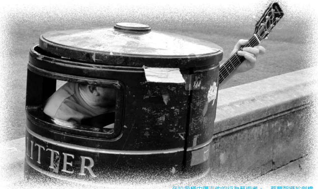
在垃圾桶中彈吉他的行為藝術家。

亞米念主義者，卻不知道 17 世紀的亞米念的神學，與天主教的“與上帝合作”救恩觀是一致的。