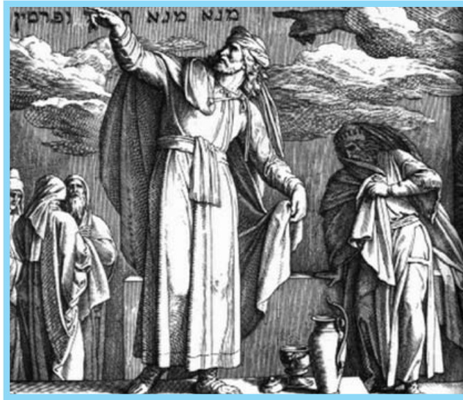
但以理在解釋牆上的字（參《但》5），德國畫家 Julius Schnorr von Carolsfeld（1794-1841）在 1851-60 之間的作品。

對修道主義影響最巨的，可說是聖本篤主教（St. Benedict，480-547）。他創立了歐洲最著