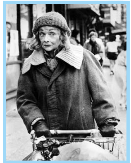
露西尔·鲍尔 (Lucille Ball, 1911-1989) 在影片《石枕》(Stone Pillow, 1985) 中的剧照。此片是描述纽约市中，一位初出茅庐的社会工作者，透过与一位老年游民的交往，体验游民生活，并学习帮助他们。

我们聆听他们的故事——过去的辉煌与欢乐、被欺骗被遗弃的痛苦、被解聘的失落与无奈、长期流落街头的无依无告和沮丧、以及诗歌与圣经带给他们的安慰。投入服事的弟兄姐妹都有同感，施比受更为有福！上帝给我们机会，接近困苦无依的伤心人，拓展我们的眼界，了解社会的真相，更让我们学习贴近耶稣基督的心肠，扬弃世人的有色眼光，以基督的眼光看人身上所显出上帝的荣美。