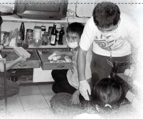
中低收入社区家访清扫