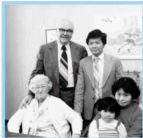
1982 年与霍金斯女士和微牧师合影