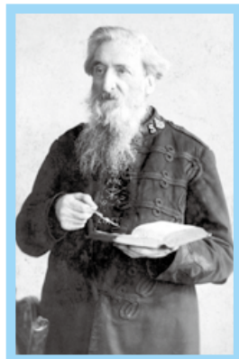
救世军创办人卜威廉 (William Booth, 1829-1912)

1865年，与中国内地会创办的同一年，救世军的“大将”卜威廉（William Booth）号召许多人加入“以爱心代替枪炮”的军队。他们自愿接受军队般的纪律，献身街头布道，救济贫民，设食物站，于是“热汤（Soup）、肥皂（Soap）和救恩（Salvation）”这3S成为这支军队被人称誉的口碑。救世军的影响遍及全球各