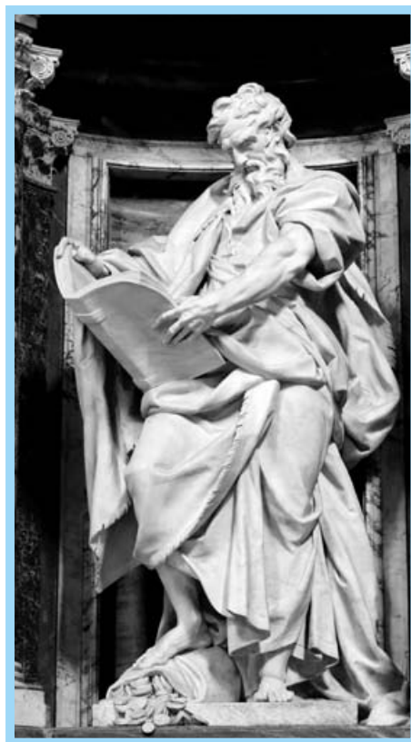
Camillo Rusconi(1658-1728) 的作品，现存于罗马的 San Giovanni in Laterano